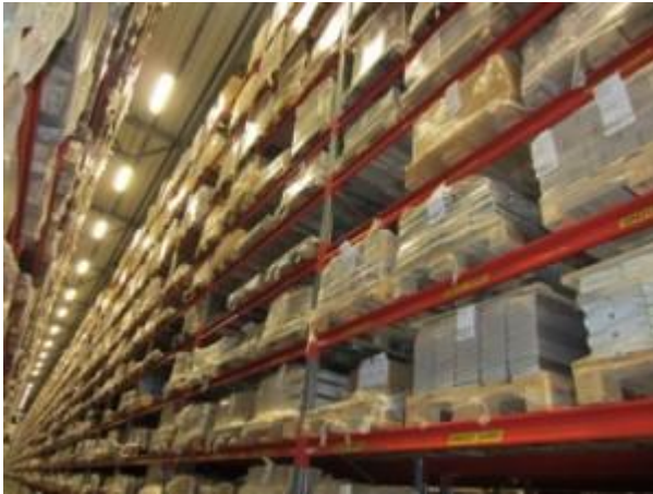
Böcker ända upp i taket på centrallagret

Wow! Det var häftigt. Vi var närmare 50 personer som hade kommit till studiebesöket hos Förlagssystem vid Tallenområdet. Tänk att få komma innanför väggarna på detta väldiga komplex som man har sett ta form och förundrats över.