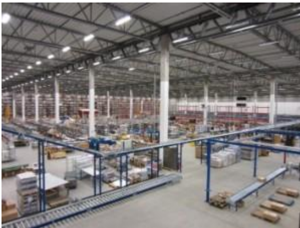
En liten del av det väldiga utrymmet

Wahlström. En och annan minns nog Wahlströms ungdomsböcker som vi läste med glädje.