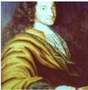
Jubilaren själv i talarstolen

P föddes på Gotland, blev faderlös vid 9 års ålder och flyttade då till en släkting i Stockholm. Sin första anställning fick han 12 år gammal hos riksrådinnan Margareta Wallenstedt i Vanstad, Stockholm där han blev inspektor vid 17 års ålder. Han visade tidigt intresse för mekanik och konstruerade till exempel en automatisk stekvändare (se bild).