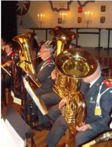
Här blåser man för välljud!

Den årligen återkommande kvällskonserteren i Dalasalen samlade 150 personer som före konserten erbjöds ärtsoppa.