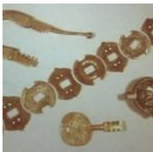
Polhemslåset fortfarande aktuellt

P var ett stort geni. Hans uppfinningar och konstruktioner lever fortfarande kvar. Till exempel fungerar hans sinnrika lås ännu idag enligt samma principer.